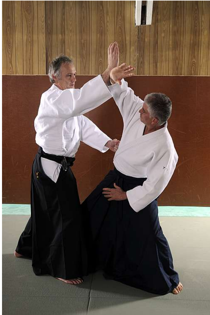
L'auteur tentant de mettre ses pas dans les pas du Fondateur (Uke : Alain Ipekdjian – Vincennes 2008)